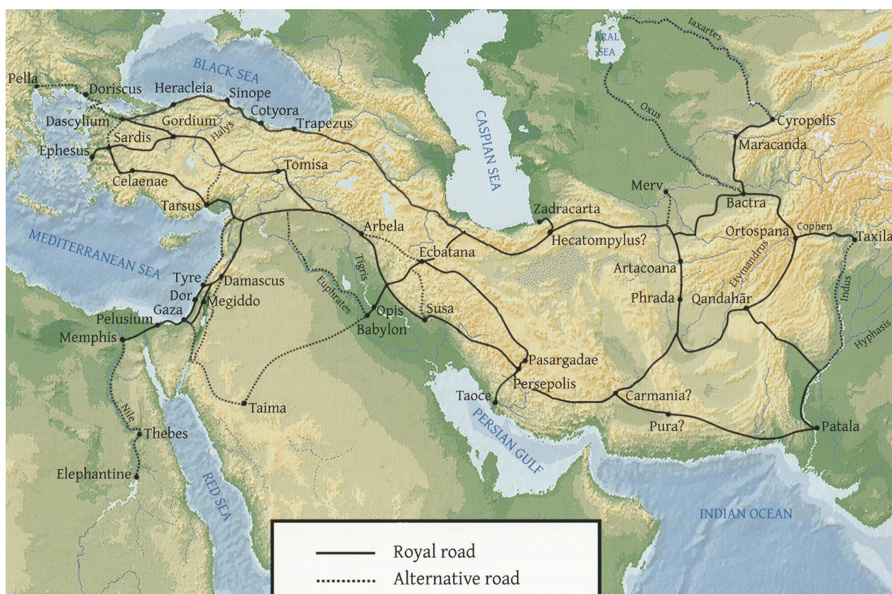
Дороги в империи Ахеменидов.

Помимо этого, идеологического представления, способствующего усилению власти царя, империя, чтобы обеспечить свою собственную сплочённость, создаёт несколько средств контроля, таких как войска и местные гарнизоны, имперскую администрацию, возглавляемую в регионах сатрапами и политику сотрудничества с местными элитами. Сердце империи связано с сатрапиями оригинальной системой коммуникаций, сетью имперских дорог с перевалочными пунктами, домами для отдыха и продуктовыми складами (Деборд 1999: 33-38; Курт 2007: 730-741; Хенкельман и Якобс 2021; карта – на рис. 3).