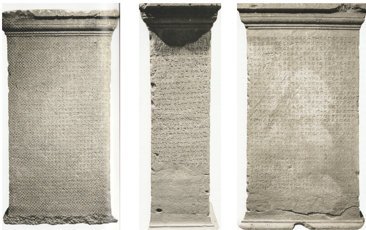
Рис. 7. Ликийский трёхязычный указ из Летоона Ксантосского.

(имперской) версией и ликийской (местной) версией (Рис. 7. Марек 2013; Марек 2016: 153).