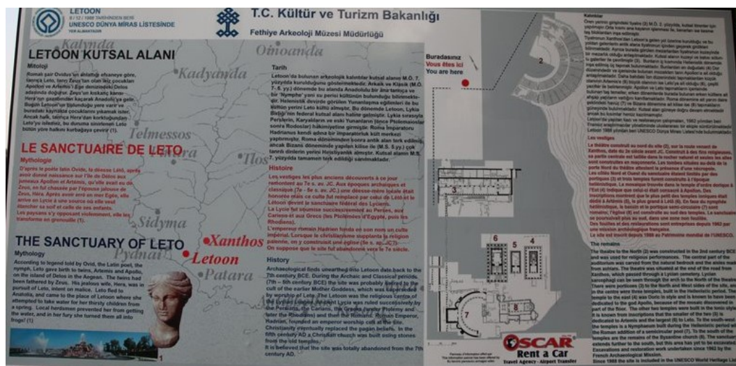
Схема древнего Летоона, города-спутника Ксантоса.