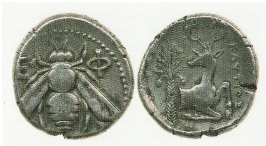
Ефес, серебряная монета, 15.29 грамм.

Ионийцы под персидским владычеством сохранили свои привычки, язык, религию, образ жизни и гражданские институты. Они продолжали говорить и писать по-гречески даже в своих публичных надписях. Персидская империя никогда не пыталась навязать персидский язык при дворе, а арамейский использовался только её администрацией. Точно также, как и в остальной части империи, у ахеменидов, которые были маздеистами [Маздаизм, или маздеизм – древнеиранская религия, предшествующая зороастризму] (Келленс 2021. Cf. de Jong 2021; Хаттер 2021), не обращали в свою веру и обычно не причиняли вреда греческим святилищам. Когда места отправления культа разрушались, это происходило не в силу религиозной политики, а как форма политического наказания, как после Ионийского восстания. Помимо таких обстоятельств, ионийцы вполне могли продолжать свои религиозные обряды и в целом жить по-гречески. Их гражданские институты можно было сохранять и даже развивать. После падения тиранов в каждом городе [Ионии] были магистраты и совет, или даже ассамблея, которые издавали декреты. Она пользовалась автономией, а также могла продолжать чеканить гражданские монеты (Рис. 6).