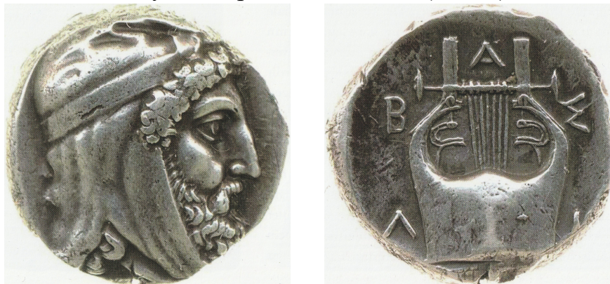
Рис. 5. Серебряная тетрадрахма персидского сатрапа (Тиссафернеса?). Британский музей.

Во время путешествия сатрап знакомил повстречавшихся ему с культурными особенностями Персии. Например, он носил тиару, о чём свидетельствуют сатрапские монеты (Рис. 5),